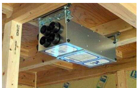
・天井に設置した24時間換気システム

現在建築中の シンエイモデルを 実際に見て頂きます。 ここまでできる シンエイモデルに