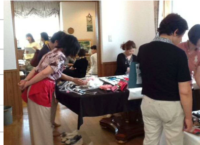
shopにはたくさんのお客さまが