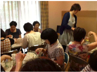
カルチャー講座の様子