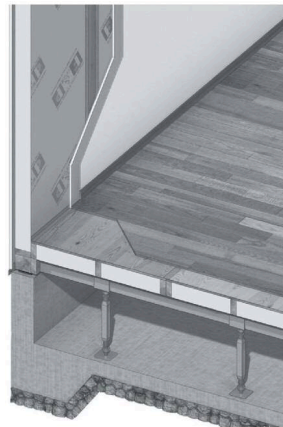
FPウレタン断熱壁パネルと床パネルの納まり

最高気温や猛暑日日数が毎年更新されるなか、真夏の太陽日射熱をどう抑えるかは省エネで快適な暮らしをするにあたり大きな問題となります。真夏には日射熱で、屋根の表面温度は70℃を超えてしまいます。FP遮断パネルは70℃という高温を遮熱層で排熱し、断熱材でシャットアウトしますので室内に持ち込むことはありません。FP遮断屋根パネルにより、従来はデッドスペースだった小屋裏空間をフル活用でき、ロフトや大きな吹き抜けなど自由な空間設計が可能となりました。